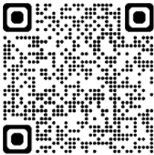
Link to AlertLine

报复是指针对举报人采取行动，也是让举报人害怕举报的行为。对报告疑虑的任何人进行打击报复都是背离本《行为准则》的行为。另一方面，我们也决不容忍恶意的及故意的虚假报告。任何人若故意参与打击报复或故意提交虚假报告都会受到纪律处分，包括终止雇佣。如果你怀疑工作场所中存在打击报复行为，必须及时通过 Hydro AlertLine 或其他渠道进行报告。