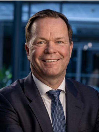
Eivind Kallevik 总裁兼首席执行官

面向2030，诚信是我们转变步伐并加速成长、价值创造和可持续性的基本原则。就像安全一样，不容商讨。